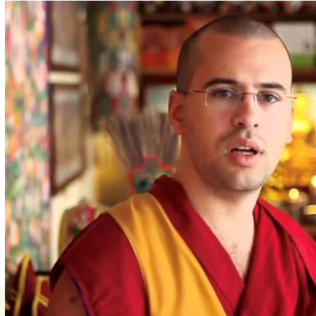
LAMA MICHEL RINPOCHE