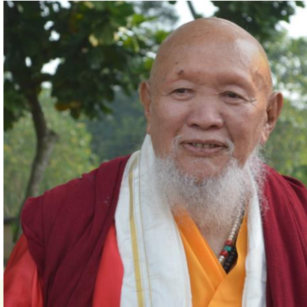
LAMA GANGCHEN RINPOCHE